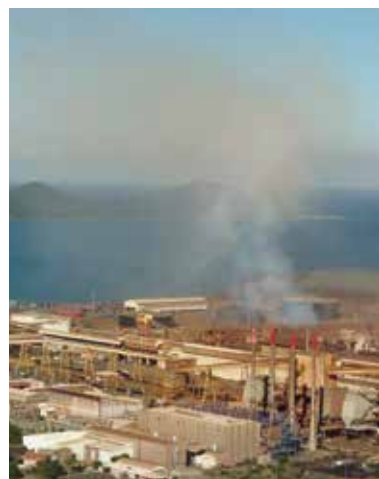
Les émissions soufrées se caractérisent souvent par une fumée jaunâtre.

Les fiouls couramment utilisés au niveau des centrales thermiques de production d'électricité peuvent contenir des teneurs en soufre variées :